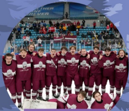
3X3 HOKEJS Latvijas U16 izlase