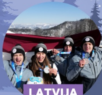
LATVIJA kamanīņu sports, stafete